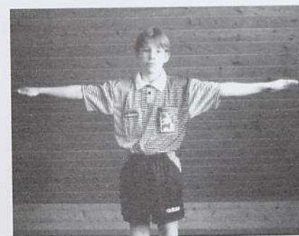
Bild 5 Annulliertes Tor