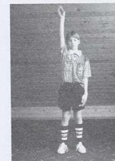
Bild 2 Vorteil