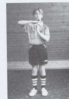
Bild 6 Zeit stoppen