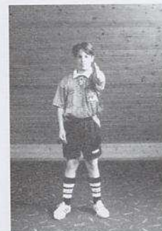
Bild 1 Torerfolg