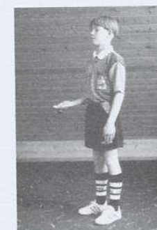
Bild 4 Spilaufforderung